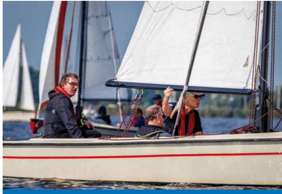
Tekst Maria Poiesz

Medio september was er voor het eerst in anderhalf jaar eindelijk weer een Special Olympics evenement in Nederland, en dat nog wel op ons eigen Sneekermeer. Het evenement was een gezamenlijk project van Special Olympics Nederland, de Stichting Aangepast Zeilen Sneek (SAZS) en de Koninklijke Watersportvereniging Sneek (KWS).