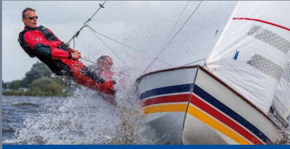
Tekst Klaas Weissenbach

We zijn in het najaar 2020/voorjaar 2021 van start gegaan met de voorbereidingen voor een regulier zeilseizoen. Helaas werd in het voorjaar 2021 duidelijk dat zeilwedstrijden in eerste instantie niet mogelijk waren op grond van de geldende Coronamaatregelen.